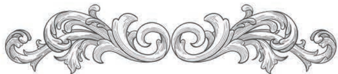
Motif style baroque

Les compositeurs essayaient d'exprimer des sentiments avec la musique.