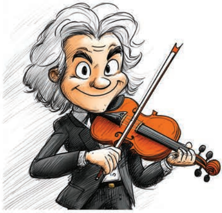
ANTONIO VIVALDI 1678-1741